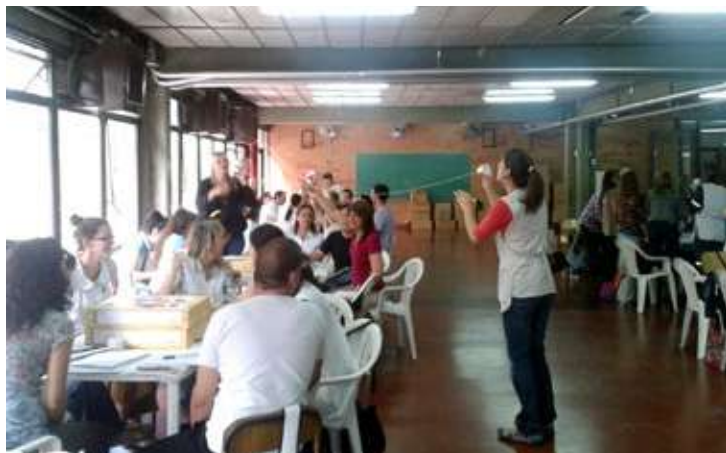
Foto superior izquierda: "Escuchando el Sonido" para maestros de escuelas primarias. Foto superior derecha: "Propiedades del agua" para maestros de Jardín de Infantes. Foto inferior izquierda: Universo "Fases de la luna" para maestros de primaria. Foto inferior derecha: "Extracción de clorofila" para profesores de biología, nivel secundario.