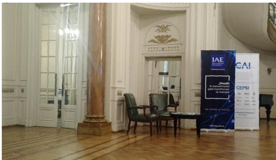
Hall de entrada del Centro Argentino de Ingenieros

Dicha reunión fue convocada por la Academia Nacional de Ciencias Exacta, Físicas y Naturales de la República Argentina y se desarrolló en el Salón "Gral. José de San Martín" del Centro Argentino de Ingenieros, sito en calle Cerrito 1250 de la ciudad de Buenos Aires.